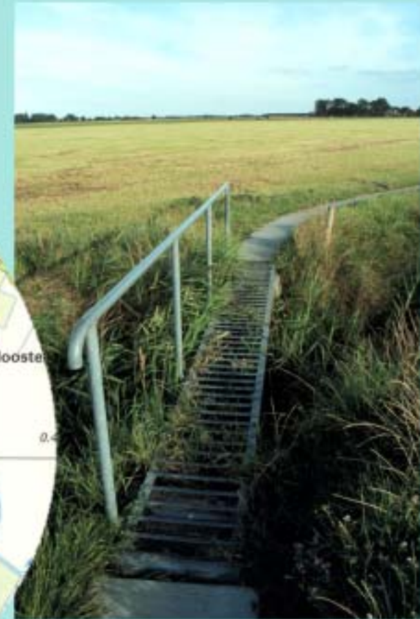
Roosterbrugje in het fietspad bij Maarhuis.

Krewerd heeft een bijzondere kerk,, gebouwd in 1280 (volgens de kroniek van Menko), met een droeve geschiedenis van Tyadeka Teteke. Het orgel is een van de oudste bespeelbare orgels, in Nederland: middeleeuws, 1531